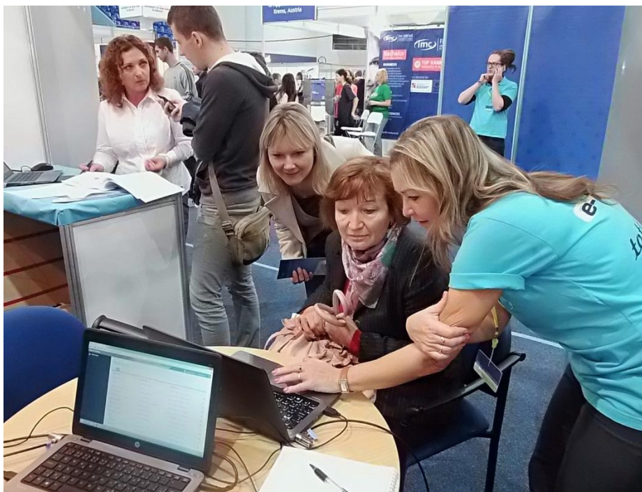
O elektronické testovanie sa zaujímali učitelia z rôznych častí Slovenska.