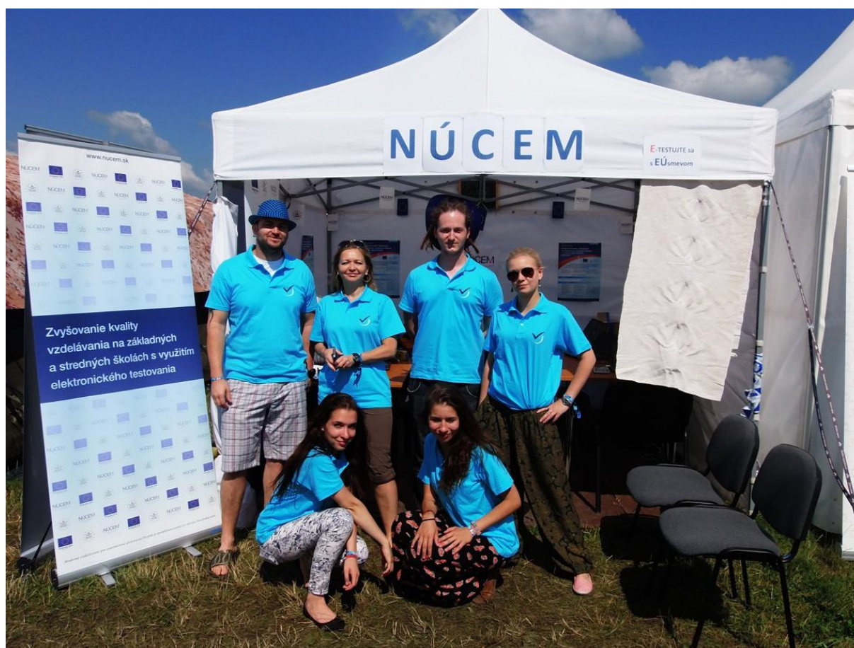
Realizačný tím aktivity E-testujte sa EÚsmevom na multižánrovom festivale Bažant Pohoda 2014 na trenčianskom letisku.